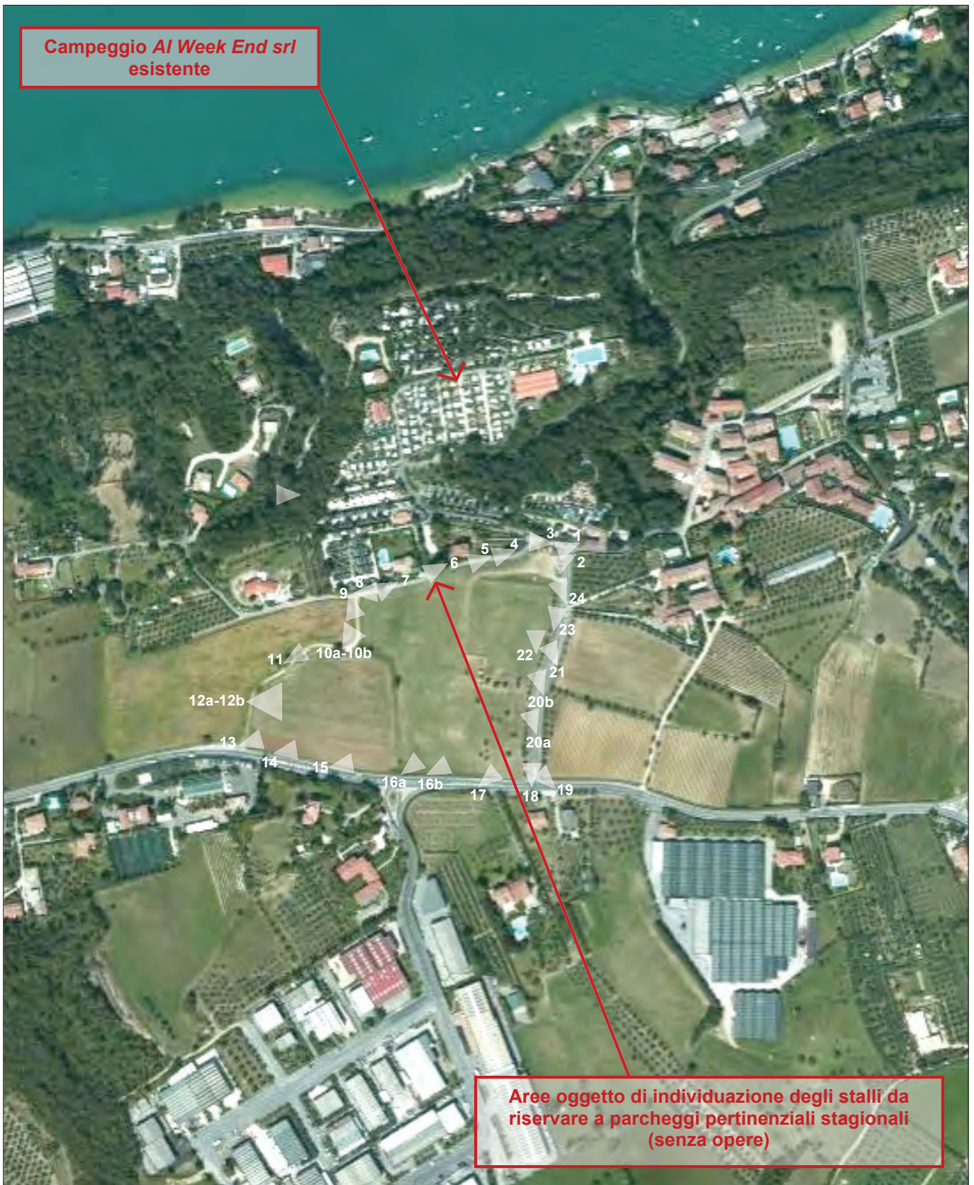
STATO DI FATTO. Individuazione dei punti di visuale sulle aree oggetto di SUAP.