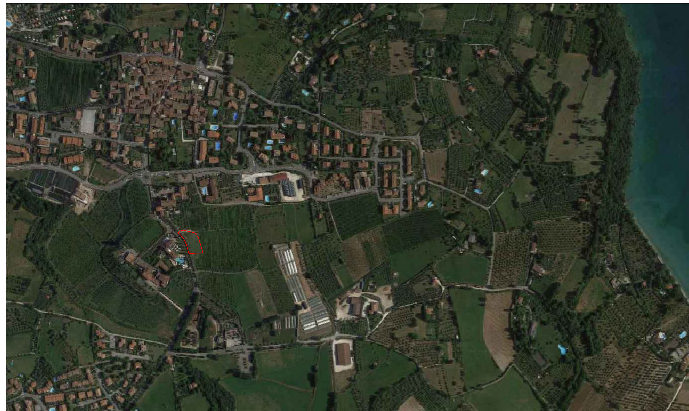
1_Ortofoto scala 1:5000